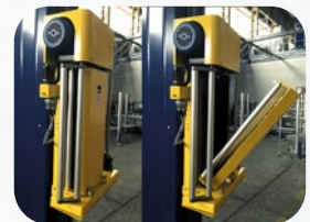
PRE ETIRAGE MOTORISE 200% * (* sur demande)